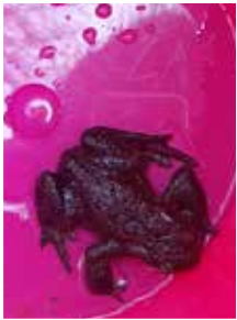
Photo des bénévoles et d'un des batraciens sauvé par un de nos bénévoles.

Après notre balade aux oiseaux annuelle , conduite par Colette Peeterbroeck ornithologue connaissant bien notre commune et ses oiseaux qui a eu lieu, le 9 avril sur les plaines agricoles de Baudemont où l'on a pu observer quelques rapaces familiers dont la buse variable, et par ailleurs une cigogne en vol et des passereaux volubiles qui chantaient allègrement, ainsi qu'une importante colonie de moineaux sur un vieux mur à l'entrée du village,